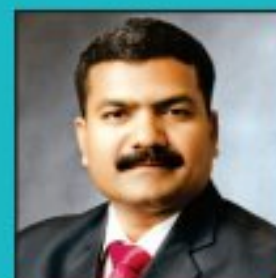
Editor : Rtn. Balaji Gharat